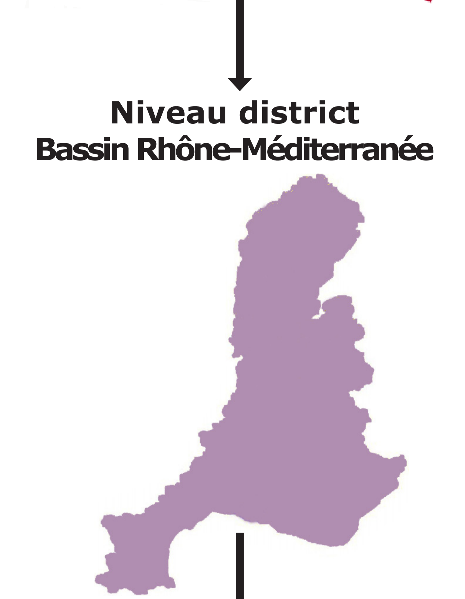
Niveau district Bassin Rhône-Méditerranée