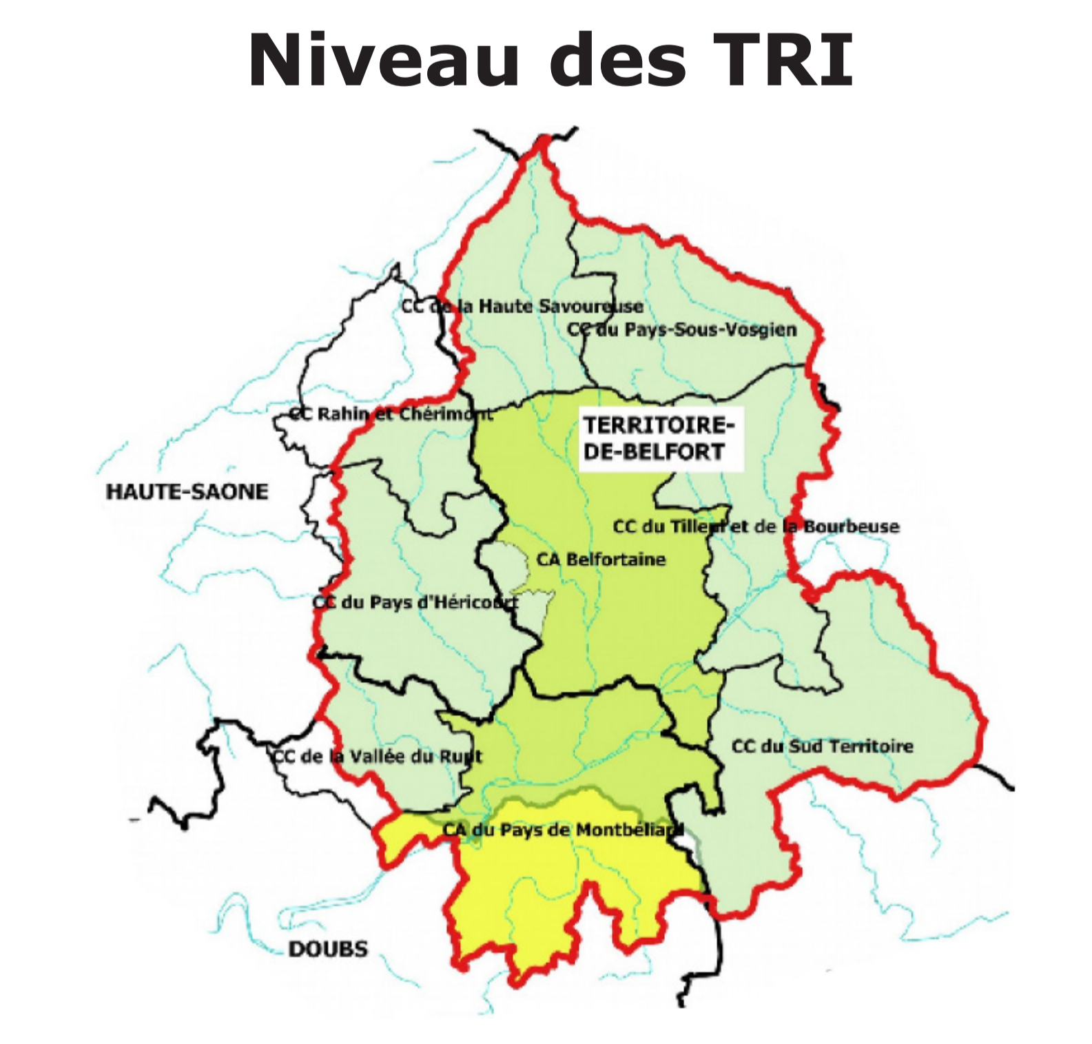
Niveau des TRI